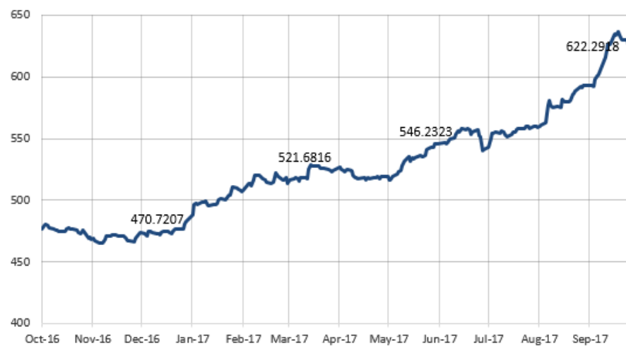
Evolutie VUAN in ultimele 12 luni (oct '16 - sep '17)

Performanta foarte buna a bursei in primele 9 luni ale anului s-a reflectat in mod pozitiv asupra valorii activelor Fondului, activul net unitar al FII BET-FI Index Invest inregistrand o crestere cu 29% de la inceputul anului in timp ce cotația indicelui BET-FI a inregistrat un avans cu cca 25,9% in aceeasi perioada. De la lansare, FII BET-FI Index Invest a supraproformat in raport cu indicele BET-FI cu cca 9,9%.